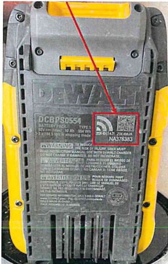
DCBPS0554 Powershift Battery Pack Top housing with Laser engraving