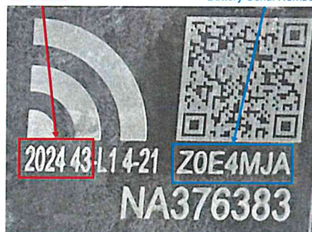
Battery Serial Number