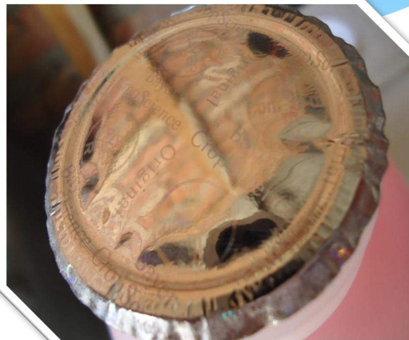
Підроблена мембрана, нанесена на фальсифікований ЗЗР