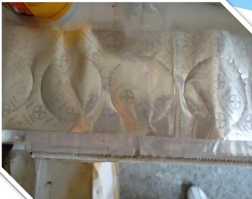
Стрічка з мембранами, зробленими під «Байєр», призначена для наклеювання на фальсифіковані ЗЗР