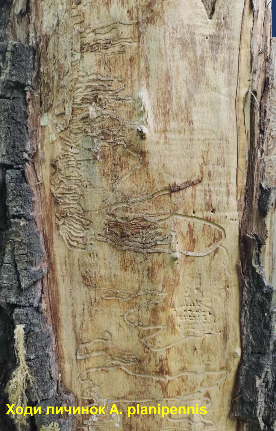
Ходи личинок A. planipennis