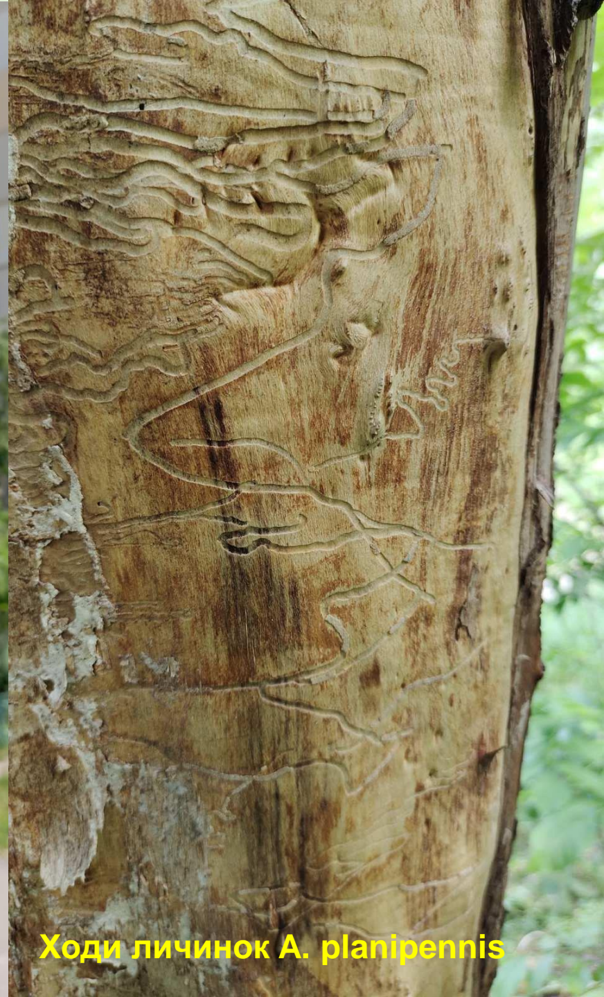
Ходи личинок A. planipennis