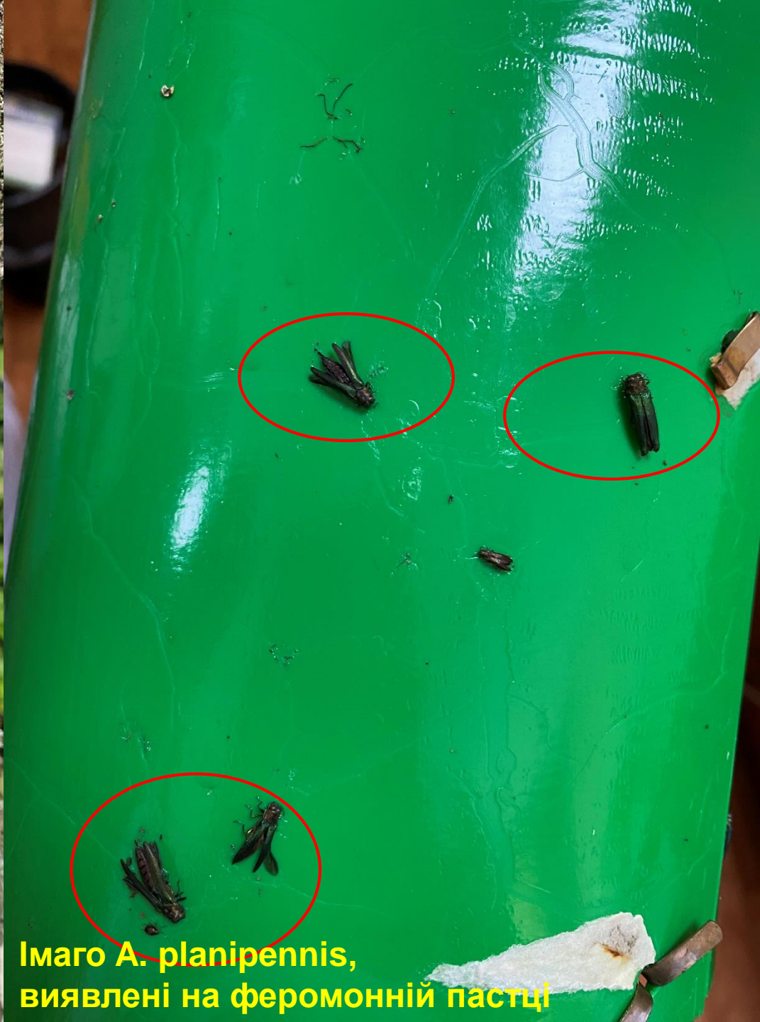
Імаго A. planipennis , виявлені на феромонній пастці