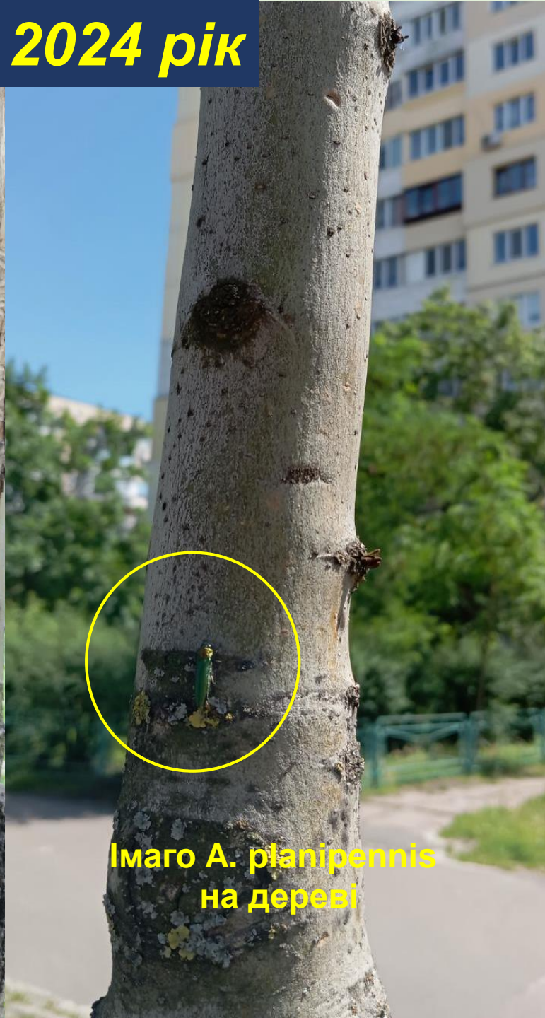
Імаго A. planipennis на дереві