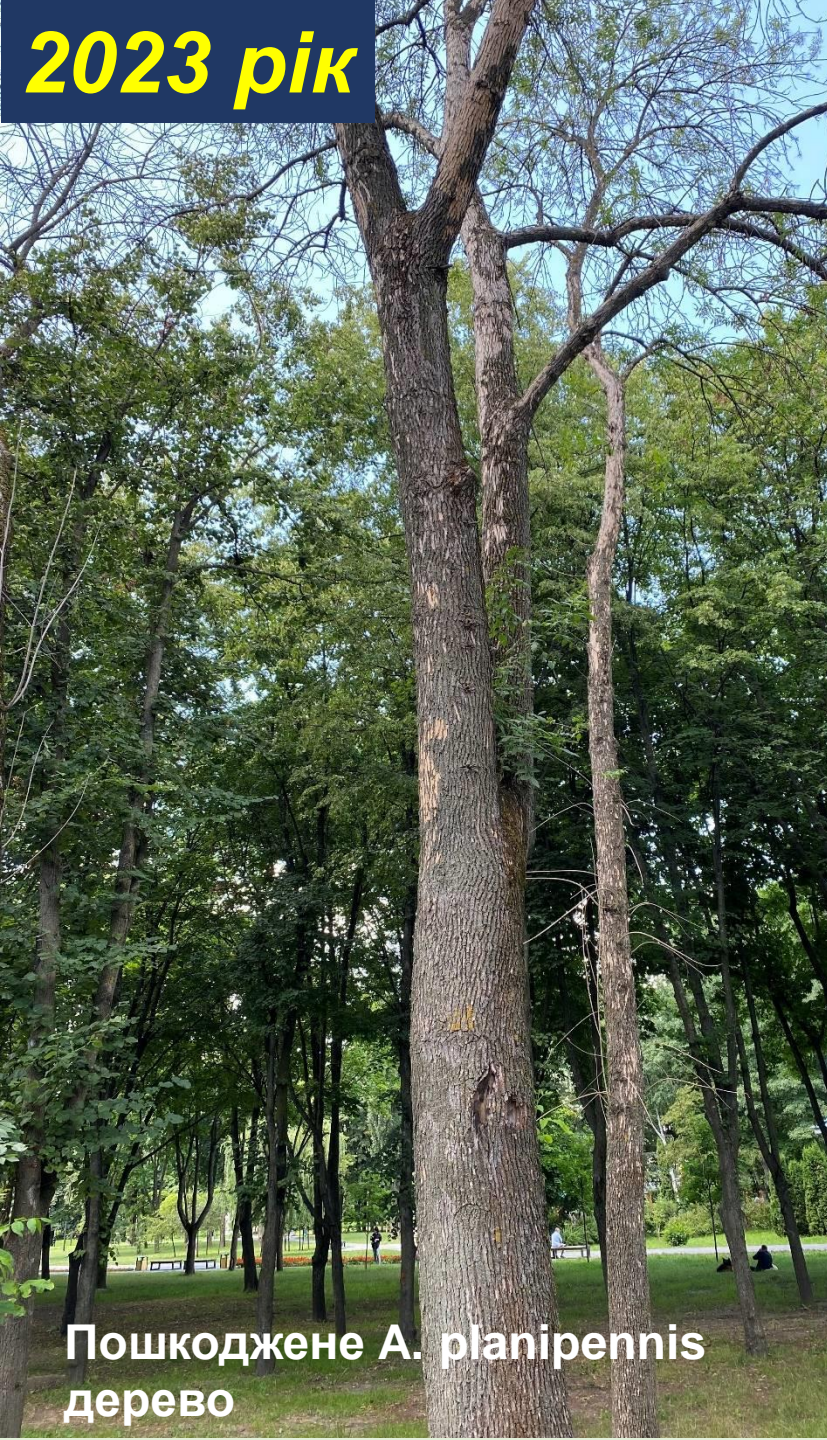
Пошкоджене A. planipennis дерево