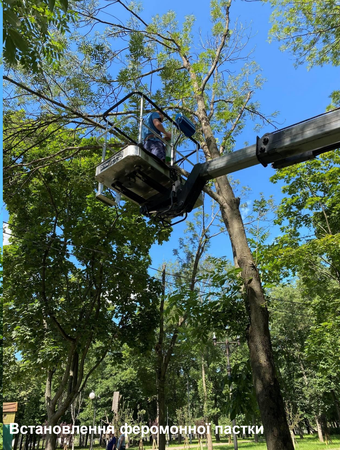
Встановлення феромонної пастки