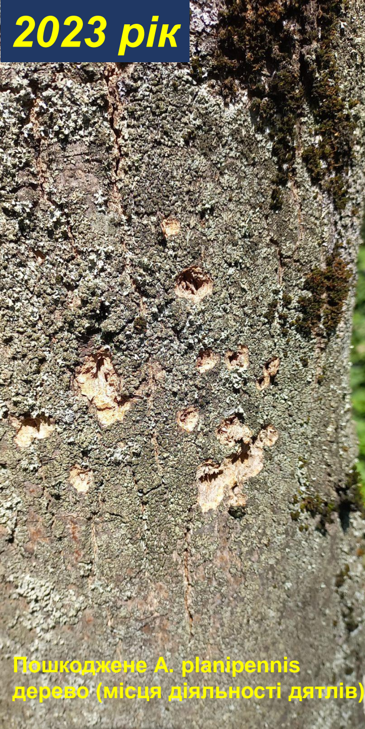
Пошкоджене A. planipennis дерево (місця діяльності дятлів)