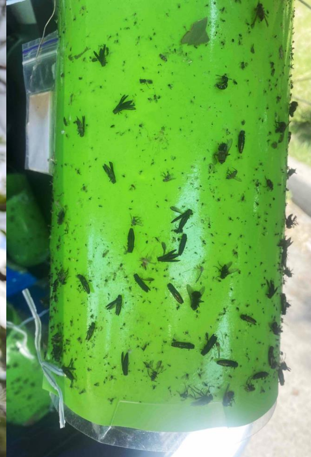
Імаго A. planipennis , виявлені в масі на феромонних пастках