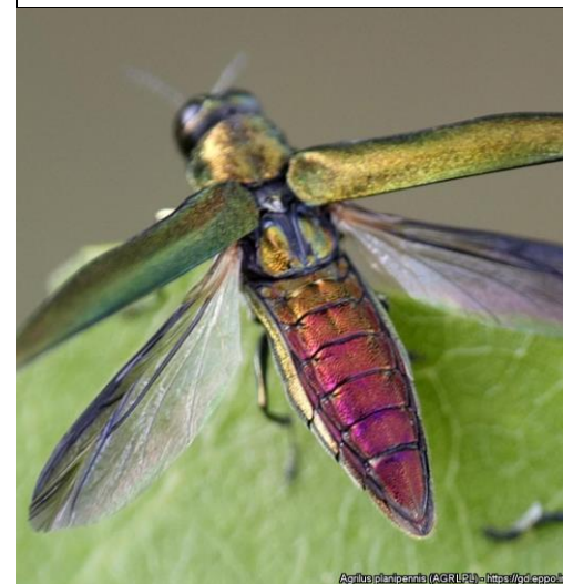
Agrilus planipennis (AGRLPL) - https://gd.eppo.int

Додаток 1 до листа Держпродспоживслужби № _____ від _____