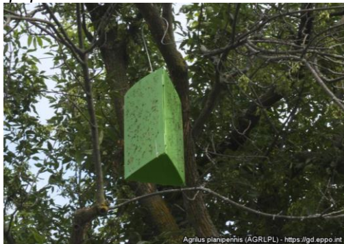
Agrilus planipennis (AGRLPL)

Призмкові пастки вивішують на сонячному боці, посередині крони, між гілками а висоті 5-8 м.